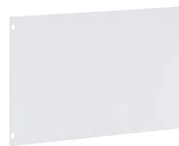
3 395 85