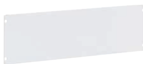
3 395 88