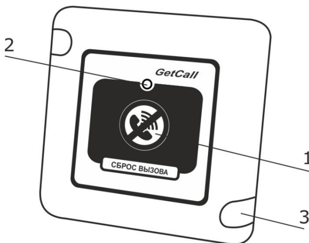
Рисунок 1. Внешний вид кнопки сброса вызова GC-0421W1

На рис.1 приведен внешний вид кнопки сброса вызова.