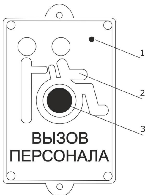
Рисунок 1. Внешний вид радиокнопки вызова МР-413W13

На рис.1 приведен внешний вид радиокнопки вызова.